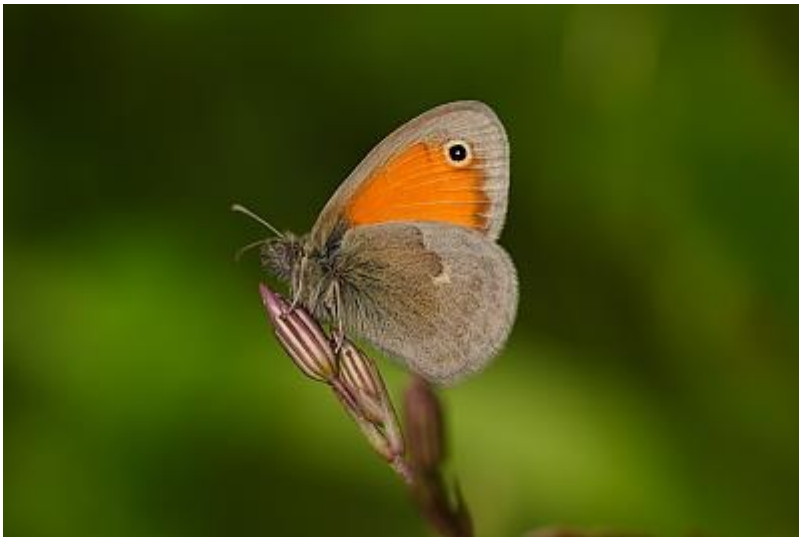
Hooibeestje. (Coenonympha pamphilus)

Dit prachtige zgn. dag-actieve nachtvlindertje vloog volop op de tijm en marjolein in de vlindertuin.