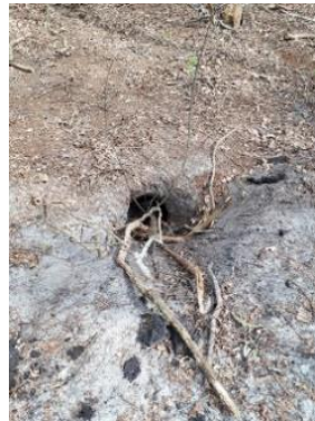
Takken in de pijp

We kregen een melding van een doodgereden das, met tepels waaruit nog melk kwam. Dat betekent dat ze nog zogende jongen had.