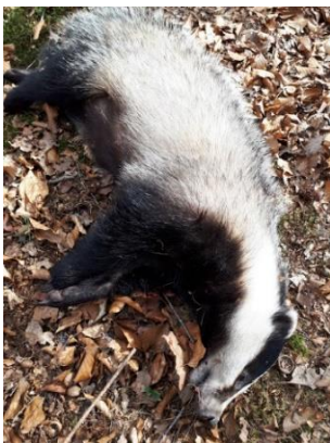
Das, melk nog in de tepels

Hierop hebben wij op de daar in de buurt zittende burcht, een camera opgesteld. Helaas waren er na een paar weken nog steeds geen jongen op te zien, zodat we moesten concluderen dat de jongen waarschijnlijk nog te jong waren en helaas zijn gestorven in de burcht.