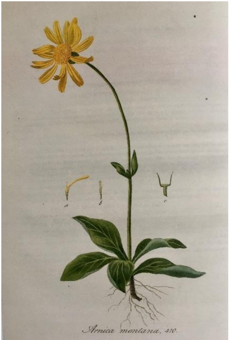
Arnica montana , 410.