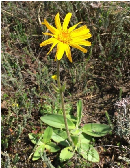
Valkruid of Wolverlei