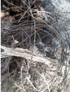
Verstoring met prikkeldraad

Ondanks dat er ook nog wel wat zorgen zijn omtrent verstoring etc. van dassen(burchten), gaat het in zijn algemeenheid goed met de totale dassenpopulatie in ons werkgebied.