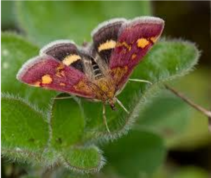
Muntvlindertje (Pyrausta aurata)

Dit prachtige zgn. dag-actieve nachtvlindertje vloog volop op de tijm en marjolein in de vlindertuin.