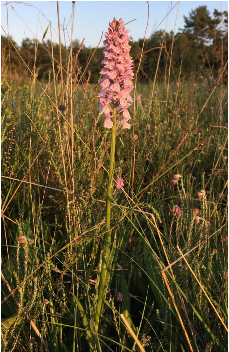
Gevlekte orchis in de avondzon.