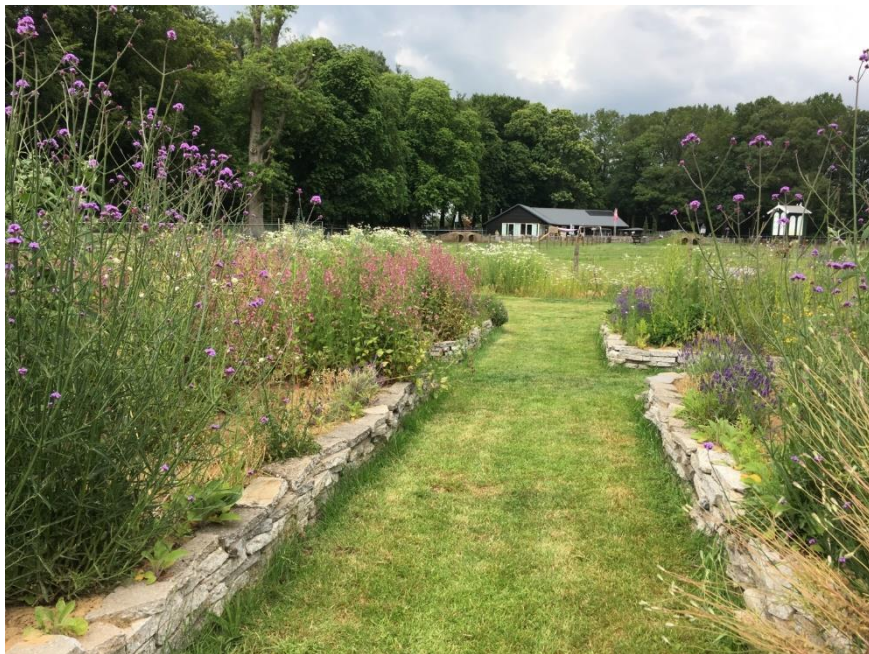
Bloemrijk doorkijkje naar de kinderboerderij.