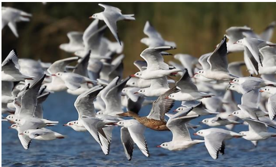
Kokmeeuwen en slobbeend

Er zijn weer zes maandelijks tellingen verricht. Jan. Feb. Mrt. Okt. Nov. en Dec. Alle tellingen zijn goed verlopen. Er was ook nu weer verstoring door recreanten en vissers. Gezien de toegenomen drukte van recreanten zal zich dit in de toekomst wel vaker gaan voordoen.