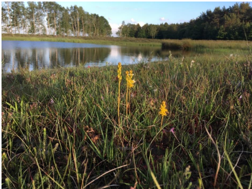
Beenbreek bloeit prachtig geel langs de oever van het ven.