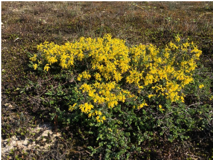
Stekelbrem. In maart/april een van de vroegste bloeiers op het Varsenerveld.